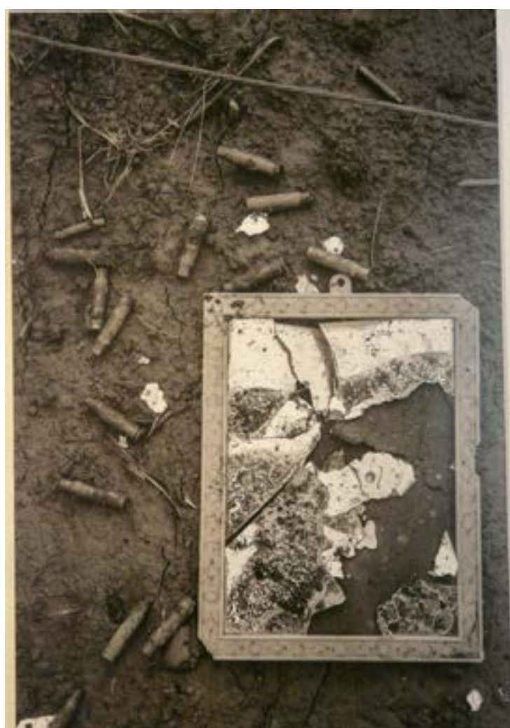
Espejo roto.

La razón anamnética debe prevalecer en los discursos de los medios de comunicación frente a los Acuerdos de Paz. Supone convocar la memoria, no para conocer un pasado de sufrimiento, sino para hacerla valer en el presente, recordando como acto colectivo de construcción de verdad y de justicia, a través de diferentes voces, para una construcción de paz más allá de lo punitivo.