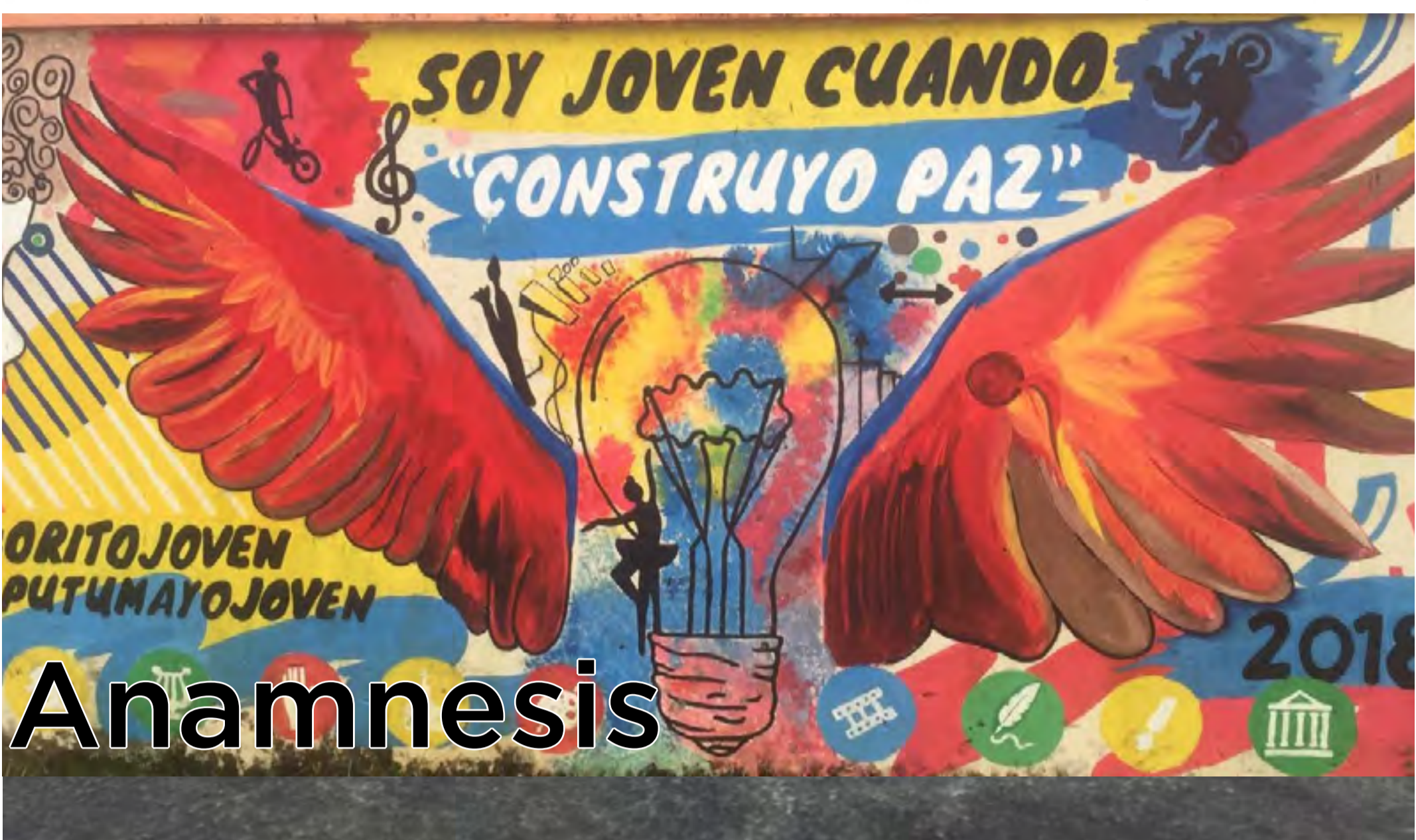
Graffiti ubicado en el municipio de Orto, Putumayo.