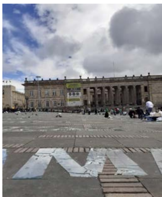
Doris Salcedo. Contramonumento Quebrantos. Bogotá 2019

El silencio y la indiferencia frente al acto violento, revictimiza. Las auras en los columbarios o las huellas de memoria en el suelo que rompen nos hace nombrar lo innombrable, sólo así se puede difundir la conciencia de aquella memoria