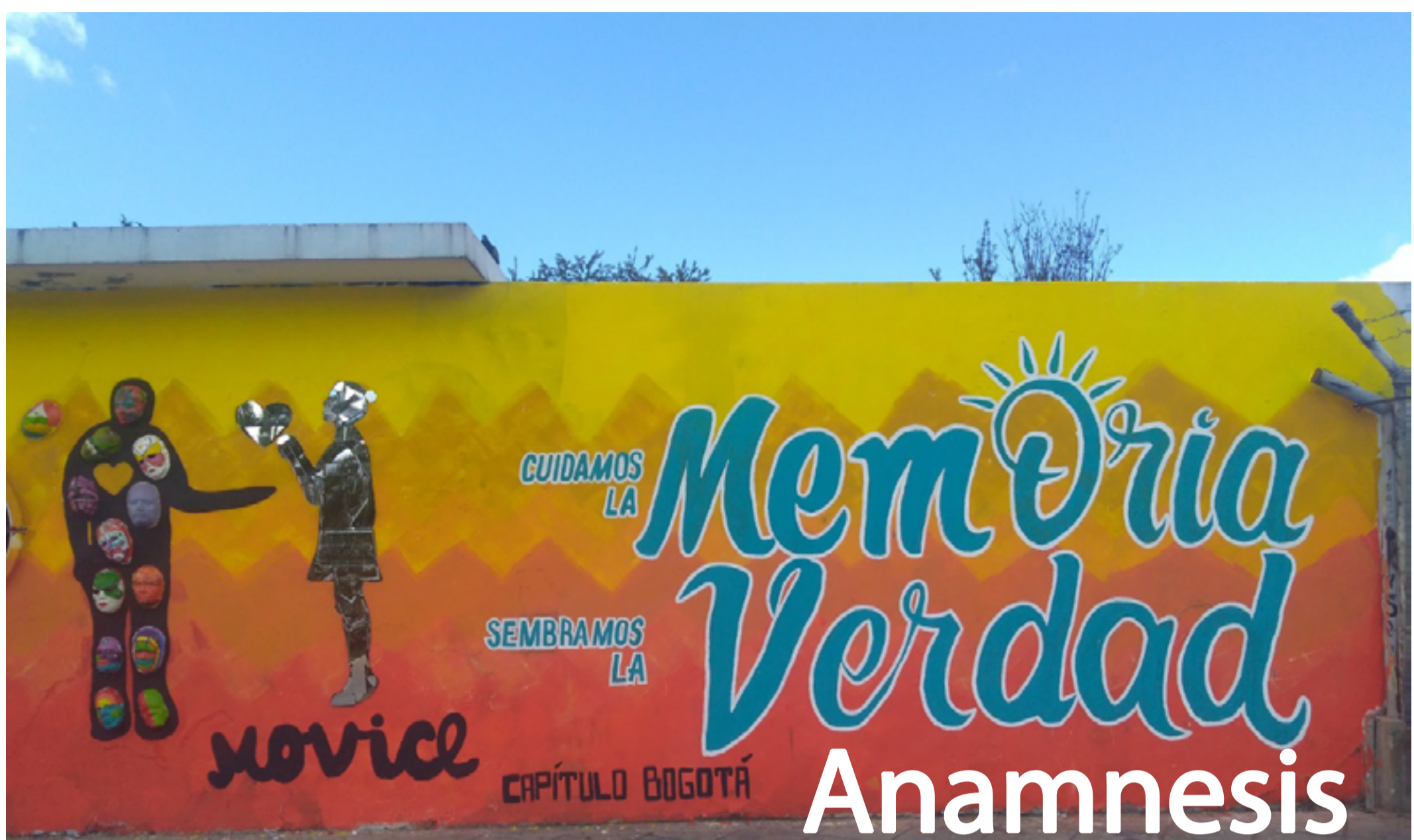
Mural anónimo. Lugar: Universidad Nacional de Colombia, sede Bogotá, 2019